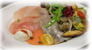
少し豪華な前菜 盛り合わせ