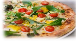
本日のオススメピッツァ